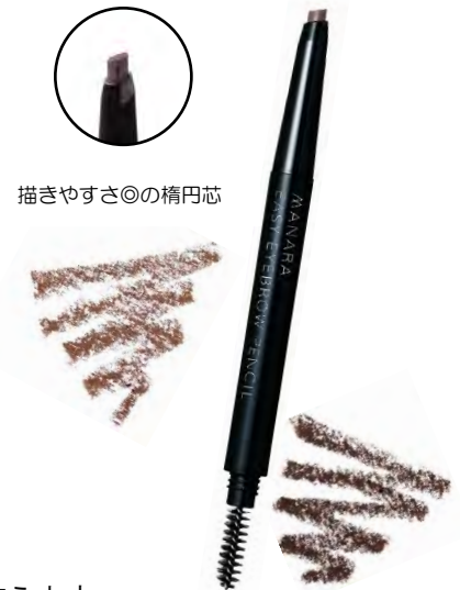
描きやすさ◎の楕円芯

ペンシルの反対側にスクリューブラシを内蔵。眉色の濃さの調節や眉の毛流れを整えます。