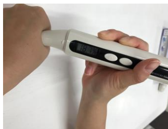
マナラ ハンドケアベールを塗らなかった場合、 30分後の水分量は18.7%と大幅ダウン。