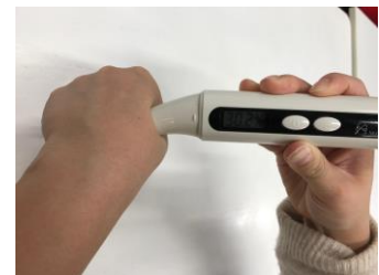
マナラ ハンドケアベールを塗った場合、 30分後の水分量は30.2%をキープ。

このように、食器を洗う前に「マナラ ハンドケアベール」を塗るだけで、洗剤や油の刺激から肌を守って、手のうるおいをキープすることができます。手の乾燥やしわ、ハリ・弾力のなさでお悩みの方は、ぜひ一度お試しください。