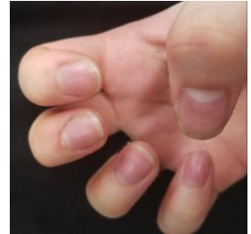
ハンドケアベールを塗って食器を洗った手