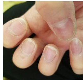
何も塗らずに食器を洗った手

ミルフィーユ状に何層にも重なったベールが、水だけでなく洗剤や油をしっかりブロック！毎日の水仕事でダメージにさらされている手を刺激から守ります。水に触れることで、水を捉えて再び膜を張るため、うるおいを逃さずキープ。手を洗うたびに塗り直す必要がありません。