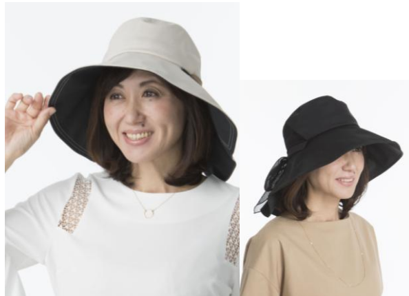
マナラ UV ガードつば広帽子 ベージュ/ブラック 各 5,500 円+税

※1 遮光率とは…人間の目に見える可視光線をカットする率 ※2 遮蔽率とは…目に見えない紫外線をカットする率