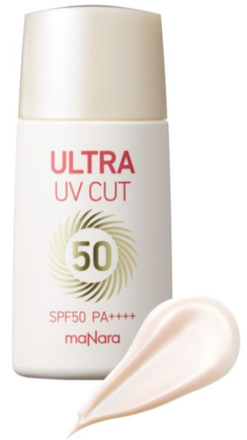
マナラ ウルトラ UV カット 50 30mL/3,500円+税

そこで当製品の「マナラ ウルトラ UV カット 50」は「紫外線吸収剤」は不使用。肌の上で紫外線を跳ね返す「紫外線散乱剤」を使用しているので、肌へのやさしさと高い紫外線カット効果を両立させています。