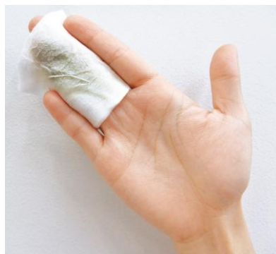
※角質が取れて汚れたコットン