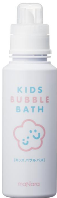
マナラ キッズバブルバス 400mL/2,300円+税

オリジナルブランド「マナラ化粧品」の開発および販売を行う、株式会社ランクアップ(本社:東京都中央区銀座 代表:岩崎裕美子)は、「マナラ キッズバブルバス」(¥2,300+税)を2016年11月18日(金)より数量限定発売いたします。「キッズバブルバス」は、小さい子どもを持つ忙しいママを助ける入浴剤です。ふわふわの泡で遊びながら体を洗うことができ、お風呂の時間が楽しくラクになります。