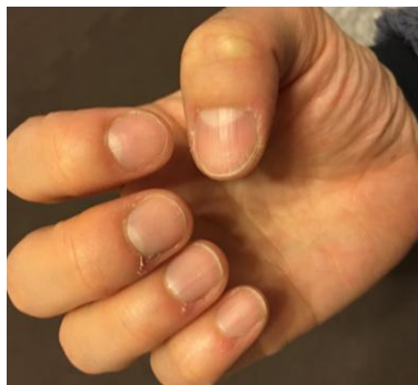
※割れてボロボロの爪