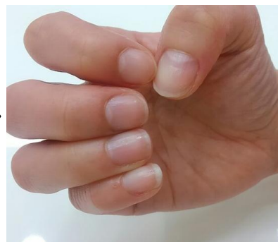
※うるおってツツヤに