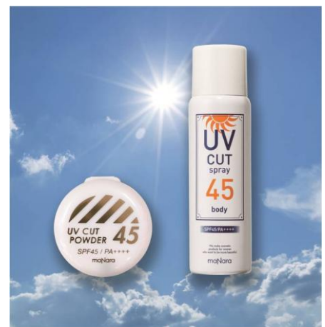
※UV カットパウダー45(左)、UV カットスプレー45 ボディ(右)

「UV カットパウダー45」「UV カットスプレー45 ボディ」は、SPF45 PA++++で夏の強い紫外線をカットすることができるUV ケアアイテムです。肌の上で化学反応を起こし、肌の負担となる「紫外線吸収剤」は不使用。肌の上で鏡のように紫外線を跳ね返す「紫外線散乱剤」を使用し、肌へのやさしさと高い紫外線カットの効果を両立させています。